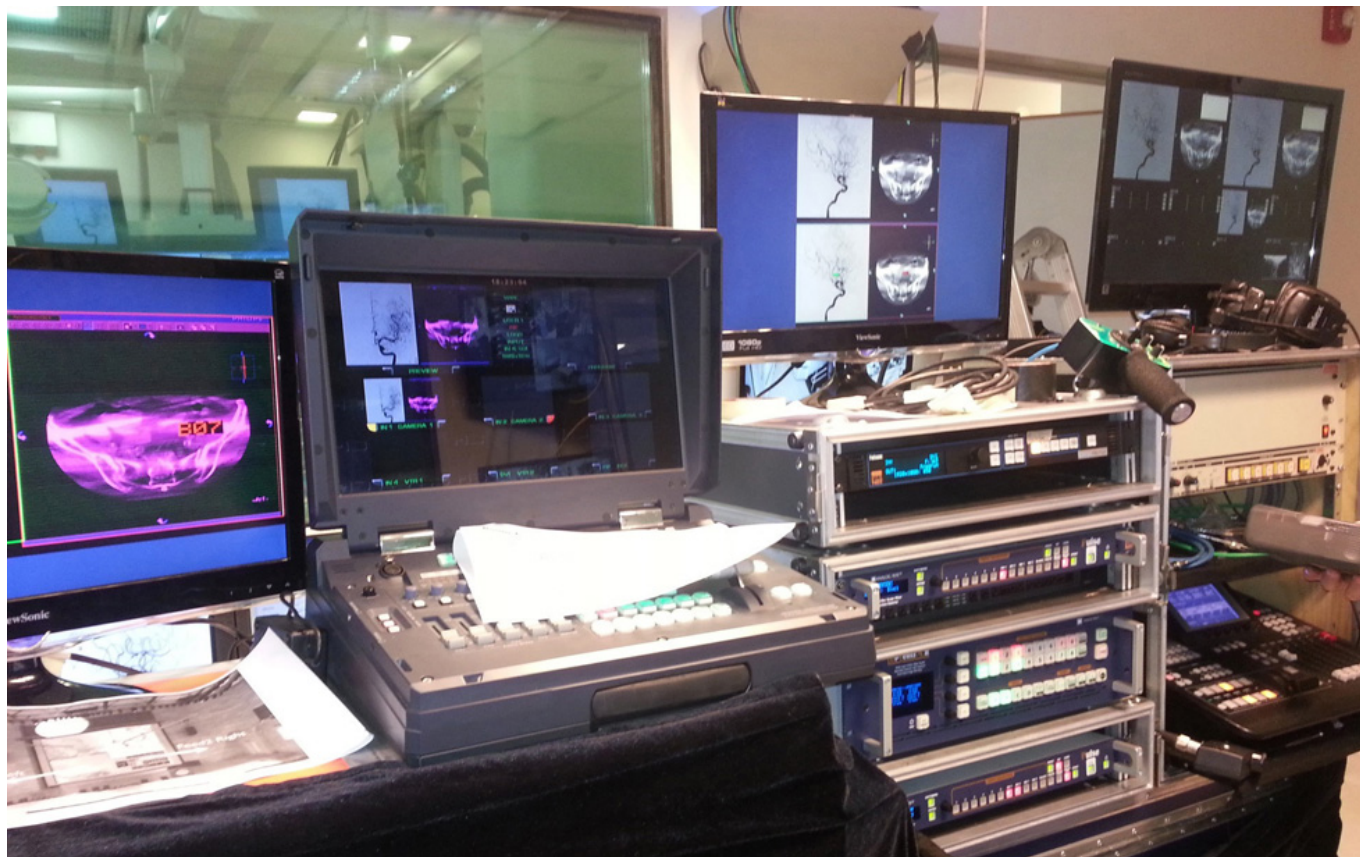
Régie en face de la salle d'opération n°1, Buenos Aires - Argentine

2MGNet a réalisé le système audiovisuel pour une conférence médicale qui s'est tenue entre Buenos Aires, Argentine et Istanbul, Turquie. La conférence a eu lieu à Istanbul, en présence de nombreux chirurgiens, autour du thème des chirurgies cérébrales. Tout au long de la conférence, les participants ont pu visualiser en direct et sur grand écran des opérations se déroulant à Buenos Aires.