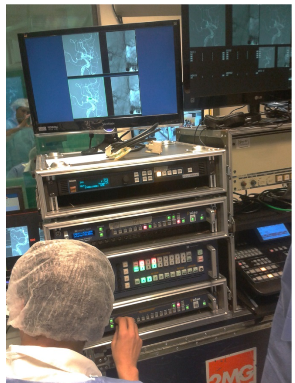
Régie de la SO2

Les deux Pulse ont été utilisés pour la SO2, afin de réaliser la même configuration d'affichage que la SO1. La seule différence était au niveau des signaux, avec un signal 3D DVI, un signal vidéo analogique et un signal SD-TV provenant de la caméra. Nicholas Sterin explique l'installation : « Afin de recevoir tous les signaux, nous avons choisi de fusionner le layer de fond avec celui du PIP sur la sortie vidéo principale du Pulse. La sortie principale du Pulse était ensuite envoyée vers le second Pulse. » Avec ce procédé, 2MGN est parvenu à réaliser la même configuration